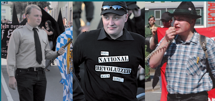
Derselbe Neonazi aus München auf thematisch unterschiedlich ausgerichteten rechtsextremistischen Demonstrationen

Hier können Sie Broschüren anfordern, die Ihnen weiteren Aufschluss über Symbole und Codes der extremen Rechten geben und anhand derer Sie die »Wölfe im Schafspelz« unter Umständen enttarnen können.